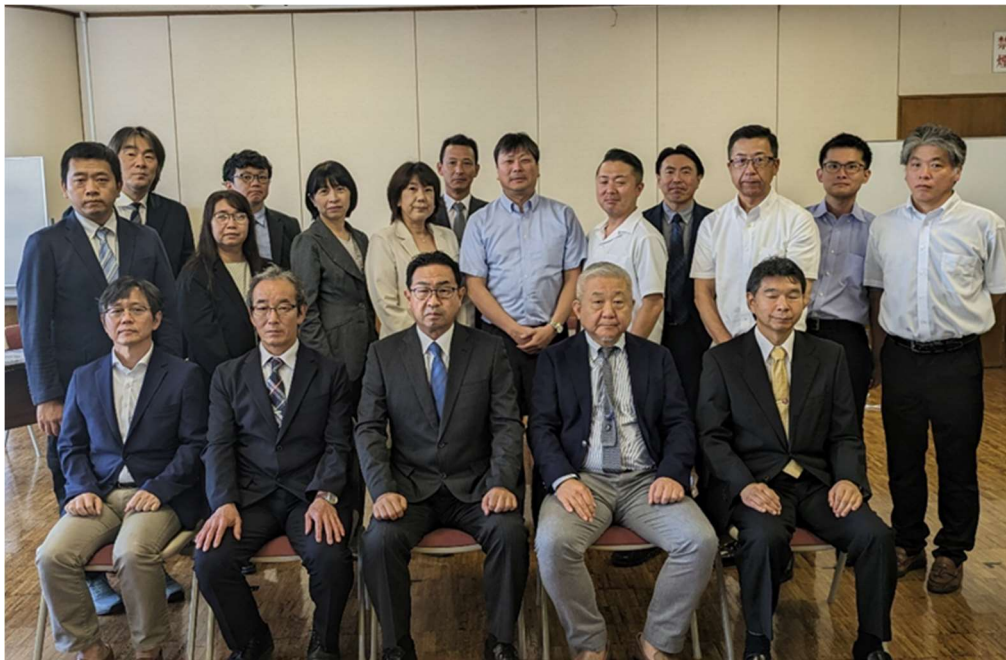
令和4年度・5年度 静臨技役員一同